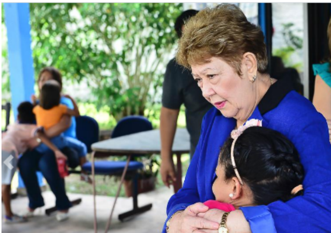
VISITA TJPA/ CEJAI - DESEMBARGADORA DR. EVA DO AMARAL

Tivemos como foco desenvolver atendimentos individuais, atividades complementares que auxiliam no desenvolvimento físico, psíquico e emocional dos acolhidos. Obtivemos um avanço na recuperação dos vínculos familiares com algumas famílias pois iniciamos um processo de visitas domiciliares, ligações e algumas demonstraram interesse em continuar mantendo vínculos afetivos, já outras famílias não demonstram interesse. Utilizamos de atividades lúdicas para estimular reflexão na busca por autonomia na tomada de decisões na vivência cotidiana.