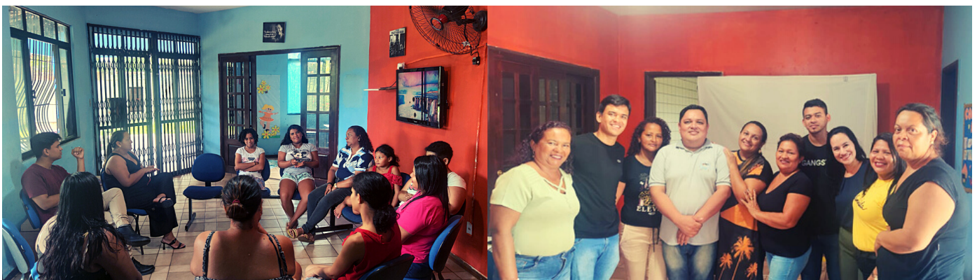
CAPACITAÇÃO DA EQUIPE E CONSTRUÇÃO DO PPP

Os trabalhos desenvolvidos em 2023 pela equipe técnica foram: acolhida, escuta, estudo social, encaminhamento a emissão de documentação pessoal, encaminhamentos para atendimento na rede socioassistencial, acompanhamento e encaminhamento na área da saúde, estímulo ao convívio familiar, social e grupal, elaboração de relatórios e do Plano Individual de Atendimento, capacitação, participação em audiências, participação em reuniões da rede socioassistencial, pesquisa junto ao INSS sobre a situação dos acolhidos que estão aguardando perícia do BPC, preenchimento de prontuários, visitas domiciliares aos familiares e atendimento psicossocial.